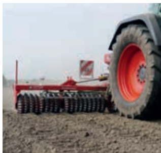
Do siewu międzyplonów na uprawianych powierzchniach