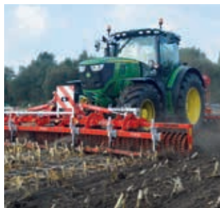
Do zwalczania omacnicy prosiowianki w kombinacji z uprawą