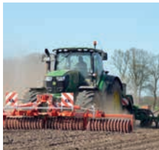
Jako Frontpacker do siewu